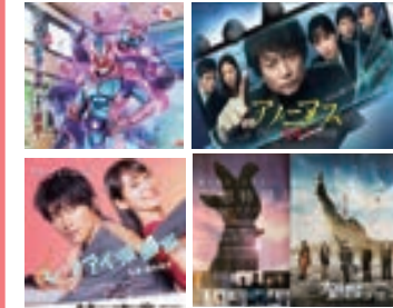
「大怪獣のあとしまつ」など

■4年の制作期間を経て完成した「吉川むかしばなし第2集」！制作には地域の多くの方々からお力をいただきました。ありがとうございました（^^）！