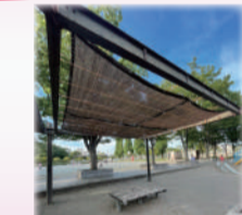
公園の休息所の上に夏の間「よしず」を設置