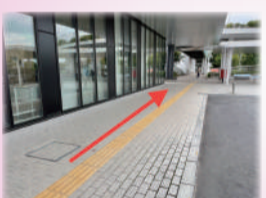
市役所の点字ブロックを「おあしす」まで接続

大きな政策や事業ではないけれど、皆さんの幸せに結びつく「小さくても大事な事業」。その一部をお伝えする「小さなことのようにけど」。