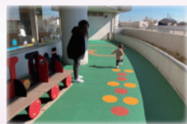
「子育て支援センター・ひまわりの丘」の外側スペースを雨でも遊べるようにリニューアル！