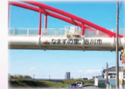
「中川水管橋」に「なまりん」のイラストや文字を入れて市外にPR！