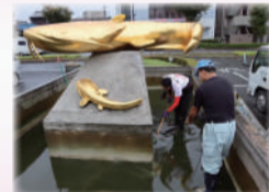
駅前「金のなまず」の池を職員と共に清掃！ピカピカに！