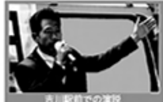
吉川駅前での演説